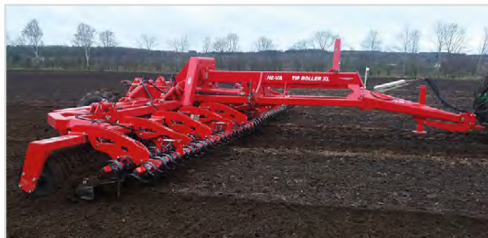
12,30 m Tip-Roller XL avec anneaux Cambridge et Spring-Board double.