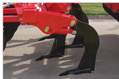
Tanddesign på Combi-Disc og Combi-Tiller MKII