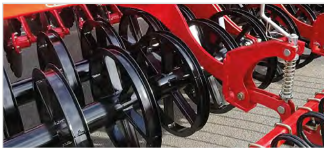
Ø600 mm U-Profilvalse Twin

*Kræver 3 stk dobbeltvirkende olieudtag og 1 stk. enkeltvirkende olieudtag.