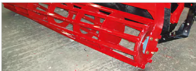
Ø550 mm Svær Rørvalse

1 Kræver 2 stk dobbeltvirkende olieudtag og 1 stk. enkeltvirkende olieudtag.