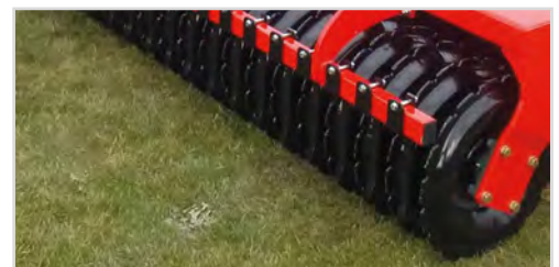
Ø600 mm V-Profilvalse