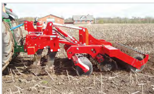
Combi-Disc med grubbertænderne løftet fri af jorden, og dermed er kun Disc-Roller funktionen i arbejde.