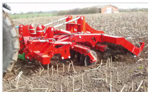
Combi-Disc med tænderne i fuld arbejdsdybde. Dermed opnås grubning, kultivering og pakning.