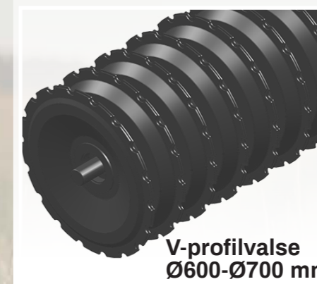
V-profilvalse Ø600-Ø700 mm

Stjernevalsen øger dræningen, konsoliderer jorden og efterlader den løs.