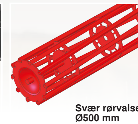
Svær rørvalse Ø500 mm