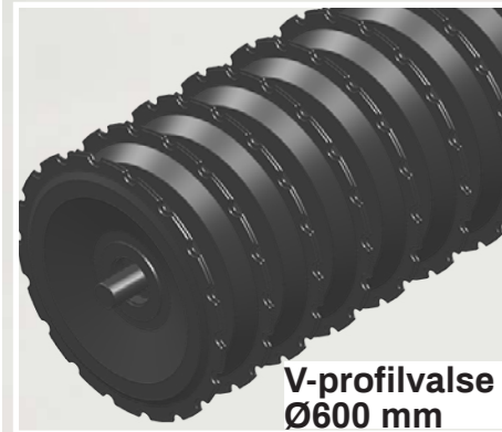
V-profilvalse Ø600 mm

Stjernevalsen efterlader jorden pakket med en løst struktureret og lettere kamformet overflade.