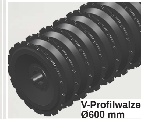
V-Profilwalze Ø600 mm

Sternwalze hinterlässt den Boden verdichtet mit einer locker strukturierten und leicht geriffelten Oberfläche.