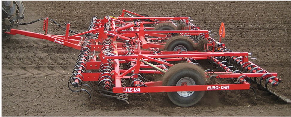
Euro-Dan Eco 8,00m m/forharv, Spring-Board planerplanka, Spring-Board efterharv och langfingerefterharv.