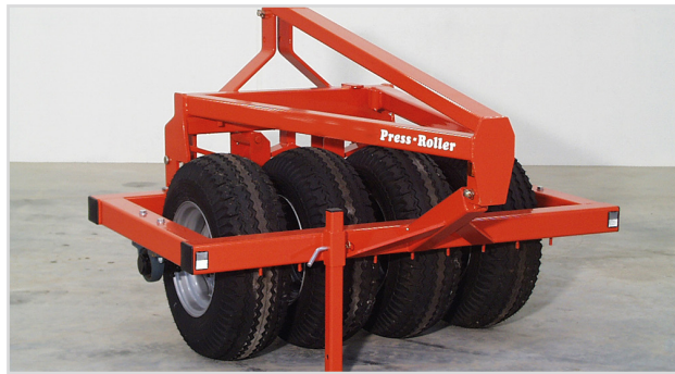
Press-Roller H760, 1,50 m.