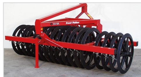
3,00 m mit 800/900/800 mm Ringe