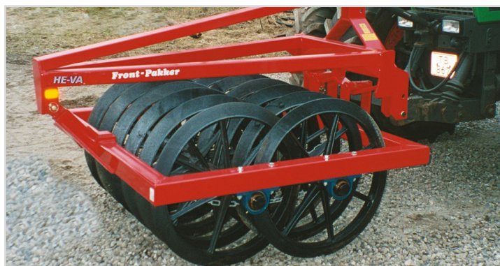
1,50 m Front-Pakker Twin m/Ø800 mm.

*1 Stck. doppeltwirkender Hydraulikanschluß erforderlich