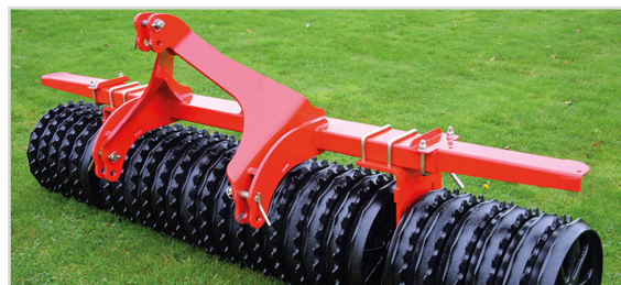
Front-Roller mit starrem Dreipunktanbau - ohne Lehnbock