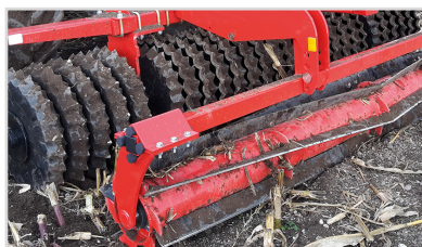
Top-Cutter auf Front-Roller