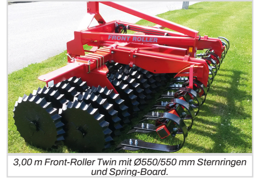
3,00 m Front-Roller Twin mit Ø550/550 mm Sternringen und Spring-Board.