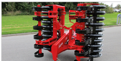
2-teilige 3,00 m Front-Roller mit V-Profil, hydraulische Klappung und Spring-Board