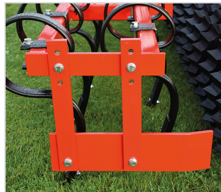
Wurfweitenbegrenzersatz für Frontegge