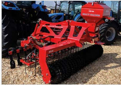
2,90 m liftophængt Grass-Roller med stjerneringe og udstyrspakke 4