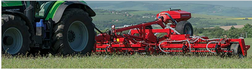
6,30 m Grass-Roller Ø710 mm med udstyrspakke 3 og Multi-Seeder