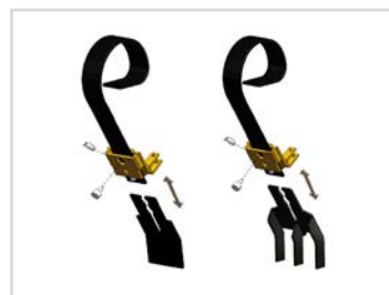
Easy-Change - Hurtigskift-system af slidspidser inkl. et sæt flade slidspidser og et sæt skorpebryderspidser med 3 tænder.