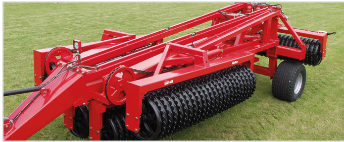
15,30 m King-Roller monterat med 620 mm/24" Cambridgeringe