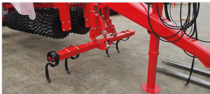
Spårluckringssats, hydrauliskt justerbar