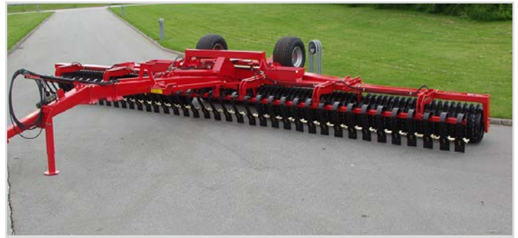
10,20 m med 620 mm/24" Cambridgeringe, med Spring-Board og tværlåsesystem