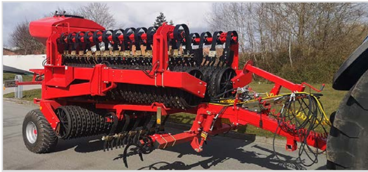
Sammenklappet Tip-Roller med Multi-Seeder, Spring-Board og sporløser