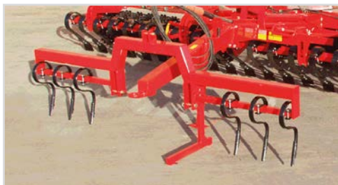
Sporløsnerramme for lift