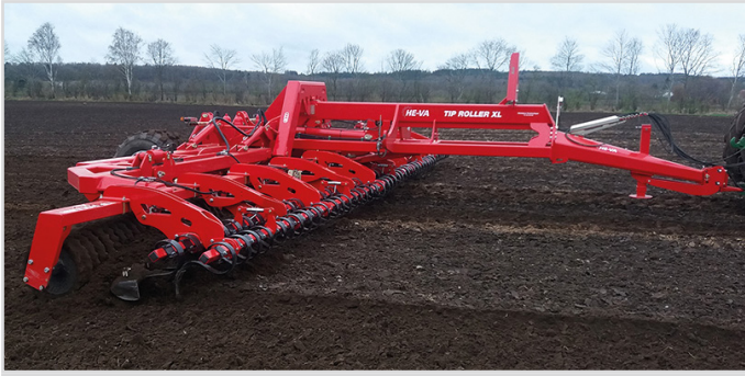
12,30 m Tip-Roller XL avec anneaux Cambridge et Spring-Board double.