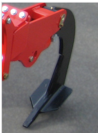
Standard 25 mm pinne m/200 mm slitspets