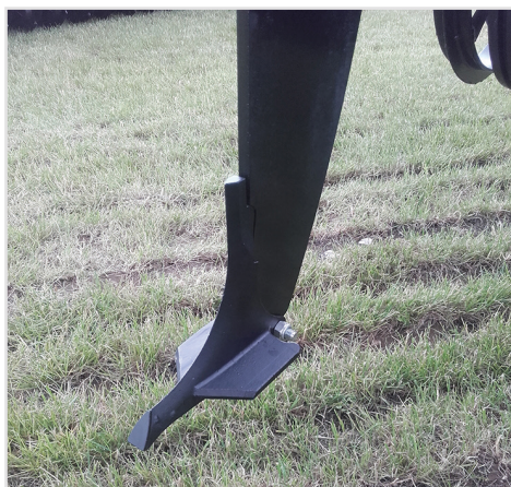
Easy-Draft kit. 15 mm tand m/120 mm slidspids med hårdmetalplatte.