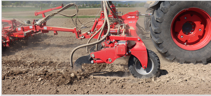
6,00 m Combi-Tiller MKII HD mit 11 Zinken