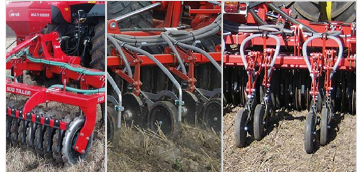
Såning i bånd før pakkervalse

Ved såning med skiveskær anvendes et parallelogram-ophængt Hatzenbichler skiveskær med dobbelt skive. Discen har en diameter på Ø350 og en tykkelse 3 mm, mens trykrullen har en diameter på Ø330 og er enten 75 eller 50 mm bred.