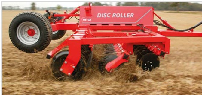
5,00 m med V-Profilring og materialedæmperskærm