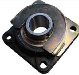
Lejebeskytter for pakvalse