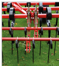
Réglage séparé de profondeur