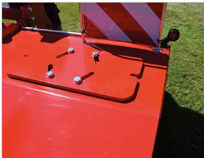
Ekstra vægte á 30 kg. Max 60 kg./m