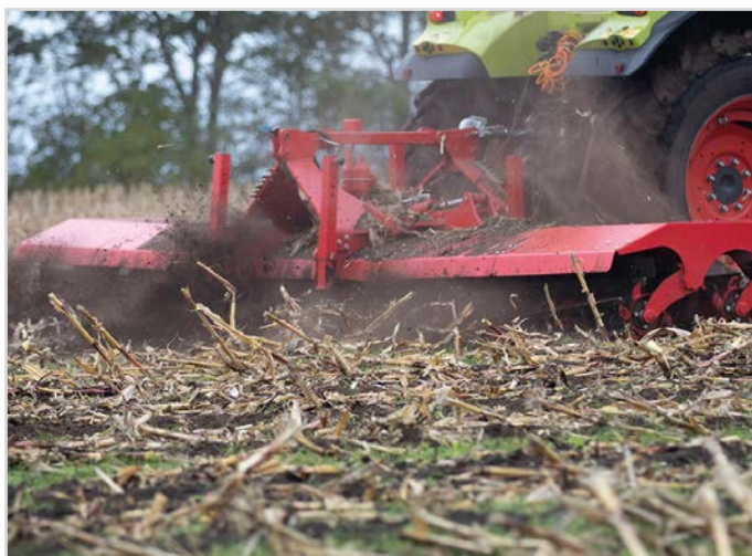
Dobbelt trepunktsophæng til front- eller bagmontering