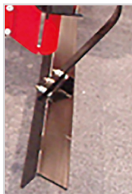
Barre de nivellement